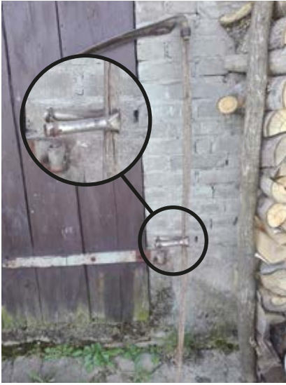
Kosa (Brzozowica)

dzano osadzenie ... to musiał być ktoś tego ... najcze n ściej brało się kosisko na szyje ... ro n czke ... i się brało do cuba re n ke ... gdy dostawałeś do cuba re n ke ... tu miałeś ro n czke ... i do cuba re n ke to powinno być dobrze ... ale ktoś se mógł zrobić albo dalej albo krócej ... ale taka zasada mniej wi n cy była ... (Bur); brało się kose ... i re n ko się sprawdzało ... wycio n gało się re n kie (!) od ro n czki ... brało się ... do końca kosa ... do ostrza ... jak była prosto osadzona ... to znaczy że jak re n ko wzięłaś to dostałaś ... a jak było źle osadzona to się potem już ... było źle ... to jes na długość re n ki ... (Grz); kosa ... to jes ... kosisko i zakończone koso ... (WDM); no ... sama kosa też się składa ... pie n tka wiem że tu jest ... nie wim jak te cze n ści reszta się nazywają ... (Gol).