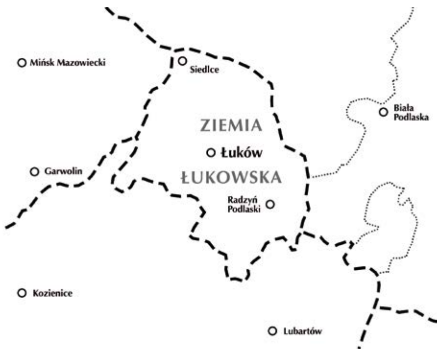
Ryc. 1 Ziemia łukowska na podstawie mapy Małego atlasu gwar polskich , oprac. Pracownia Dialektologiczna (od t. 4 – Pracownia Atlasu i Słownika Gwar Polskich) Zakładu Językoznawstwa PAN w Krakowie, t. 1–2 pod kier. K. Nitscha, t. 3–13 pod kier. M. Karasia, Wrocław–Kraków 1957–1970. Powyższe granice są umieszczone na mapach podkładowych dołączonych do tomów MAGP

z drugiej zaś wymowa typu brad matki , brad odjechał sprowadzająca się do udźwięcznienia bezdźwięcznej głoski występującej na końcu wyrazu przed samogłoską lub spółgłoską typu m , n , l , r (tzw. spółotwarte) rozpoczynającą wyraz następny. Gwary mazowieckie charakteryzuje brak owego udźwięcznienia (tzw. udźwięcznienia międzywyrazowego lub też tzw. wymowy poznańsko-krakowskiej), a więc jest tu powszechne – niezależnie od wykształcenia językowego rozmówcy – brat matki i brat odjechał . Mówiąc zaś o mazurzeniu, powinniśmy pamiętać, że owej „wymianie” podlega jedynie głoska zapisywana jako ż (a więc: zaba , zyto ), nie podlega jej w żadnym wypadku głoska zapisywana jako rz (a więc: rzeka ). Tak więc i regionalnie poprawne będzie mówienie typu zyto za rzeko .