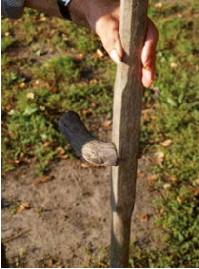
Ro n czka

zależy jak tego ... mniej wie n cy kosisko bliżej ... bliżej kosy ... w każdym bo d ż razie ... ro n czka musiała być; jak dalej jest ro n czka odsunie n ta od kosy ... to jes cie n żej kosić ... (Bur); ro n czka ... re n kojeść ... (N)j; to tylko były te ro n czki ... to ... co ty mówisz ... te podwójne ... take co były wio n zane ... to tylko robili ich (!) ci ... jeżeli ktoś ... dwóch kośników chciało jedno koso kosić ... bo przypuszczalnie ... taki prosty przykład ... o! ... tak jak ja stoje ... ro n czka powinna być przy pasie ... nawet jeszcze bliżej ... bo ona powinna być niżej ... bo ona powinna być przy biodrze ... a jak trafił się wyższy (!) to se ro n czke podniós ... rozumisz ... żeby sie ... jak chciał kosić ... żeby sie nie musiał kłaść ... i dlatego te ro n czki były wio n zane ... bo ta ro n czka była składowana ... sznurkiem ... jak widziałeś ... sznurkiem skre n cana w środku ... bo ona ... dlatego że ona była regulowana ... mogłeś jo opuścić ... mogłeś jo podnieść ... a sznurkiem tylko regulowałeś sobie wysokość; kiedyś to