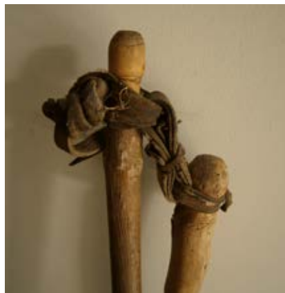
Go n zewka

go n zewka – ‘skórzane połączenie bijaka i dzierzaka w cepie’: był dzierzak i bijak ... i tak zwana go n zewka zrobiona z rzemienia ... to był rzemień ... (Grd); u nas to mówili gó n zewka ... gó n zewka ... gó n zewka ... (SKb); go n zewka ta ... (WKs); zob. gó n zewka, gózewka .