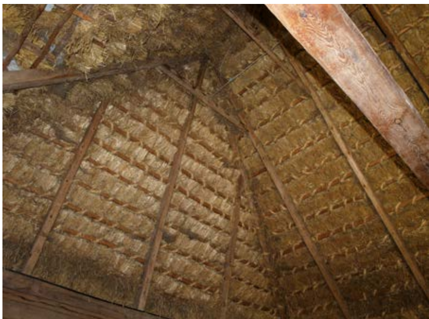
Strzecha (wewnątrz)

strzecha – ‘słomiane pokrycie dachu’: dawni były stodoły tylko drewniane ... żebra ty stodoły innymi słowy ... były z drewnianych bali ... wie n kszych lub mniejszych ... i stodoła tak samo była drewniana ... i na to dopiero kryte ... ja jeszcze pamie n tam czasy ... kiedy w moim domu ... był dach na sto-