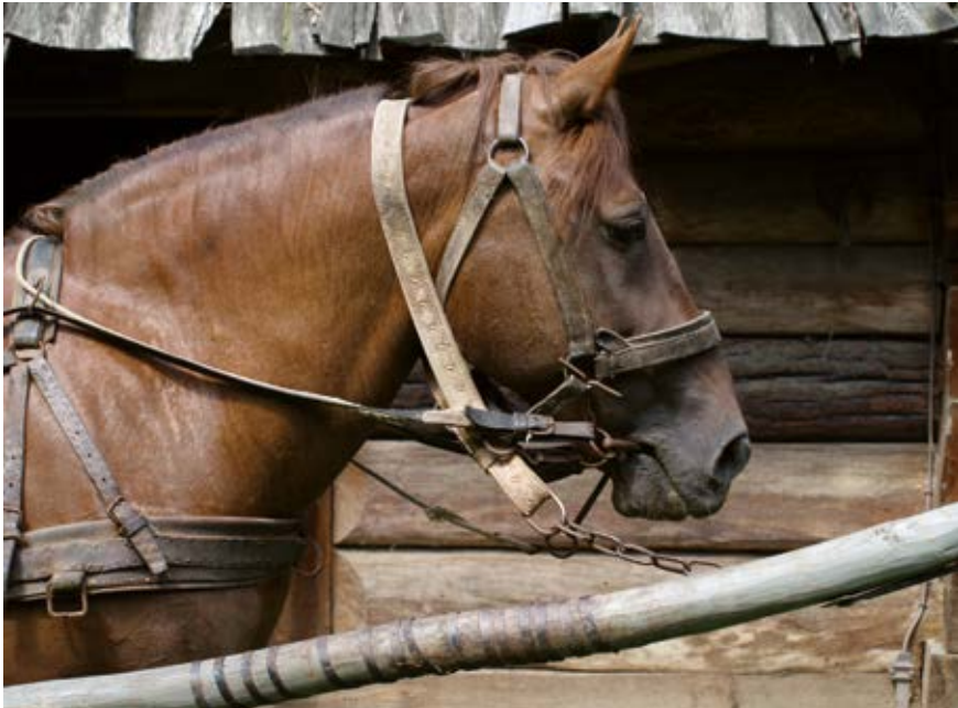
Kantar i kełzno