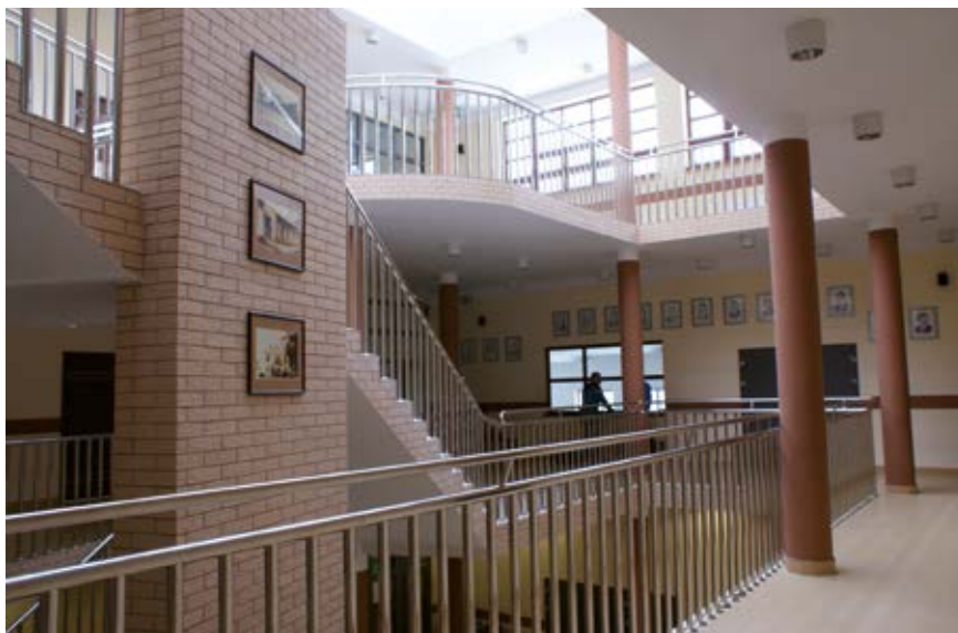
Fot. 4 Hol szkolny

oraz uczniów z Białorusi w Łukowie są okazją, by młodzi ludzie bliżej poznali kulturę sąsiadów.