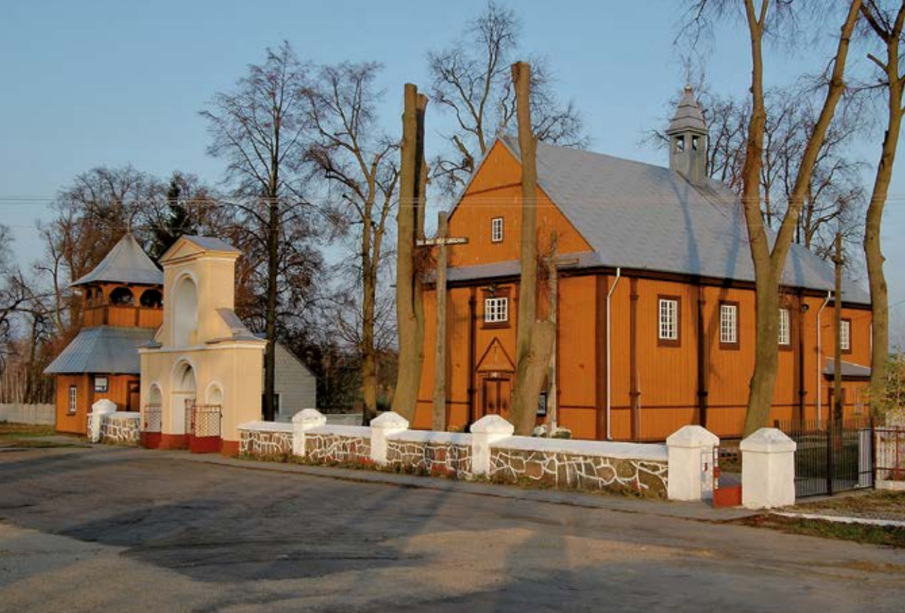
Fot. 14 Zofibór. Kościół pw. św. Zofii

XVIII w. przez Potockich. W XV w. znajdował się tu zamek Kazanowskich, a w latach 1685–1709 właściciel dóbr radzyńskich podkanclerzy Stanisław Antoni Szczuka, korzystając z usług architekta królewskiego Augusta Locciego, wzniósł barokową rezydencję typu reprezentacyjno-obronnego 13 .