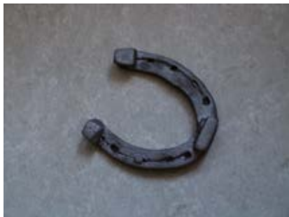
Podkowa letnia

letnie były podkowy ... a bo widzisz ... zimowe podkowy to miały haccele ... a letnie podkowy to miały z przodu ... tu na ... był taki płaskownik rozgrzany ... a tutaj te konce (!) wywinie n te ... że podwójna wysokość ... żeby koń nie ścioł tej podkowy szybko ... ale to już letnia podkowa ... na tych podkowach koń nie szed zimo; to były podkowy letnie ... to już sie te z hacelami na lato sie wykre n cało ... no ... wykre n cało sie ... odymało sie koniowi ... a brało sie letnie podkowy ... tak jak tera do samochodu zimowe opony ... tak samo i koń ... (Dąb); b. zimowa: zimowe podkowy to miały haccele ... (Dąb); c. z gumą: jak już ... no już dorosłem ... nie dorosłem ... ale podrosłem ... i jak zacząłem koniem jeździć ... to w Garwolinie ... to był ewenement ... bracie! ... tam był jeden kowal ... i to on ci robił podkowy na zamówienie na zime ... ale tutaj ... z tyłu ... pod te pie n te konia ... podawał gume ... i to była guma z opony ... (Dąb); podkuwały konie ... to tak zwane ... w gumy kuly (!) ... o tutaj ... tutaj była zamiast hacely (!) ... to była na poprzek guma ... i była ... dwa nity przynitowana ... to przód był tego ... a tutaj była guma ... zamiast hacely (!) ... była gruba guma ... i na poprzek guma ... (Czr).