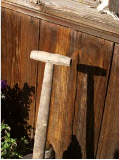
Korzystka (u szpadla)

ro n czka albo korzystka ... nie wiem dlaczego akurat tak ... ale ... można powiedzieć ro n czka ... można powiedzieć korzystka ... nie? ... jeżeli ktoś się orientuje to wie o co chodzi ... jak ja pamiętam z małych lat ... to ojciec mój to mówił korzystka na to ... łopaty to raczej tam były z prostym trzonkiem ... bez tej korzystki ... no aczkolwiek już później te mniejsze ... ja jak pamiętam tam ... to były proste ... bo te wie n ksze to majo przeważnie ... miały! ... bo teraz to przeważnie ... o! ... tak jak to ... można powiedzieć ... nowy szpadel ... to już jes i metalowy trzonek ... i ... i ten ... (Czr); korzystka i trzonek; re n kojeś to jes trzonek ... i ... zależy ... bo to różnie mówili ... ja mówię na to korzystka ... tak jak u nas mówili ... korzystka ... a w innych regionach Polski mówili impel ... (Śwd); [szpadel] cze n s żelazna ... korzystka na ro n czce może być ... poprzeczna ... (Gol); 2. 'przy-mocowany z boku kosiska uchwyt umożliwiający koszenie': korzystka to