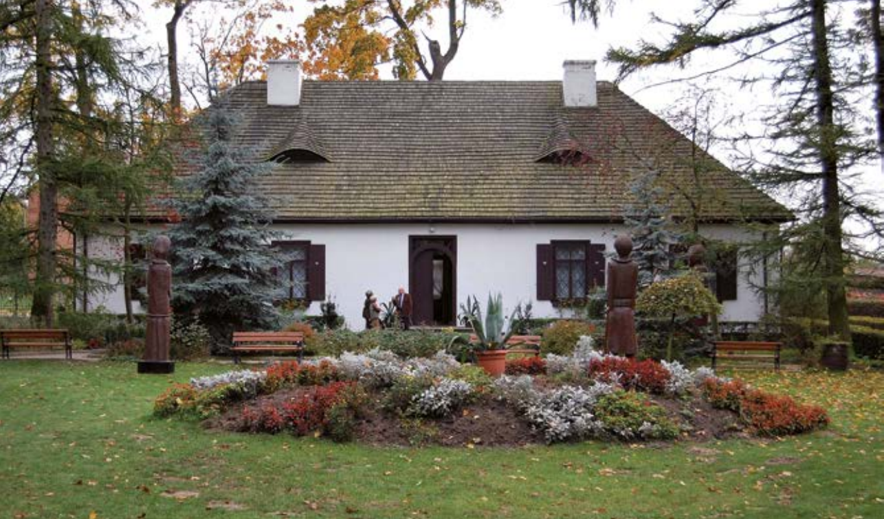
Fot. 10 Wola Okrzejska. Muzeum Henryka Sienkiewicza

głównym ośrodkiem tej części dawnej ziemi łukowskiej, która zwrócona była ku Lublinowi, Siedlce natomiast bardziej ciążyły ku Warszawie.