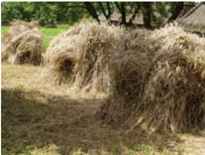
Żniwa dawniejsze

że n dło – ‘ostra, tnąca część kosy’: jes ta zasada ... że już inaczy sie młotkiem klepało ... tylko ... o te babky ... tak jak tyś mówił ... nie poże n dlyeś (!) ... nie porybileś (!) tyle ... jeżeli ktoś dobrze trzymał ... bo ... jak za przeproszeniem ... trzymał źle ... to nie wyklepał ... bo że n dło rozcio n gnoł ... to jeszcze ... że n dła ... a kosa była niewyklepana; kosa była odkry n cona odwrotnie ... a żo n dło musiało ... nie widziaeś że n dła ... jak sie że n dło ci układa ... (Dąb); zob. ostrze, żo n dło .