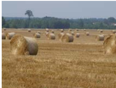
Żniwa współczesne

żniwa – ‘pora, okres koszenia zbóż’: w pszenicy było ... ale to była śmieć ... czarna ... ale jak zgmiotleś ... to to sie rozsypywało ... i to śmierdziało ... i jeżeli była ta śmieć w pszenicy ... to już pszenica była do kitu ... a ten spór ... teraz ja sie z tym nie spotkałem ... bo i żyta ni ma ... ale ja jeszcze ten spór ... chodziło sie przed żniwami ... a zanim zaczęło sie kosić ... a nawet jak sie kosiło ... jak byłem mały ... no! ... nawet ojciec kosił twój jednego roku tu u nas ... a myśmy chodzili ... ja chodziłem ... ten spór wyrwałem z tych ziarek ... bo to w aptekach od cholery płaciły (!) ... ja potrafiłem sobie zarobić przez dzień tyle ... co kośnik przy koszeniu ... (Dąb); ta praca była organizowana dwa razy w roku ... na wiosne ... pod ziemniaki ... pod buraki ... pod warzywo ... i wywózka gnoju była znów ... obornika tak zwanego ... była na jesieni ... po żniwach ... pod żyto ... po prostu pod