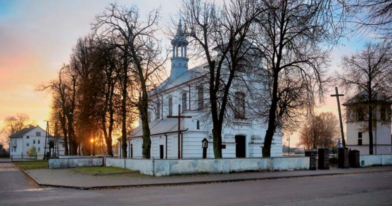
Fot. 12 Adamów. Kościół pw. Podwyższenia Krzyża

nego (1,3%) liczba mieszkańców maleje. W latach 2002–2016 zmalała o 0,9% 12 .