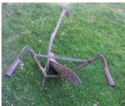
Ro n czki