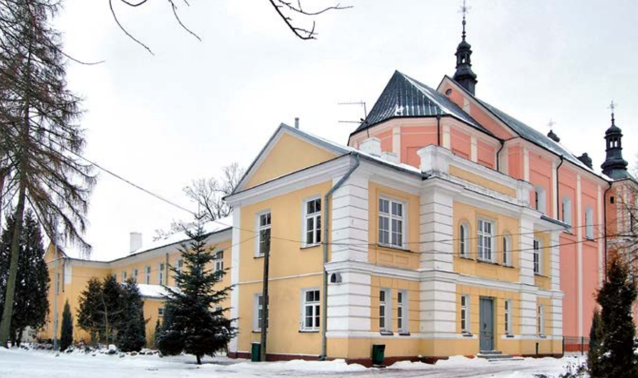
Fot. 5 Zespół klasztorny bernardynów, niegdyś gmach Liceum Ogólnokształcącego im. T. Kościuszki w Łukowie

Zasady regulują podpisane z uczelniami umowy partnerskie. Młodzież ma okazję uczestniczyć m.in. w wykładach i warsztatach prowadzonych przez pracowników akademickich.