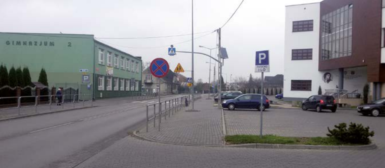
Fot. 1 Dawna Szkoła Podstawowa nr 2 i współczesne wejście do I LO

łukowskiej stwarzała okazję do swoistego „rozliczenia się” z gwarami tego regionu.