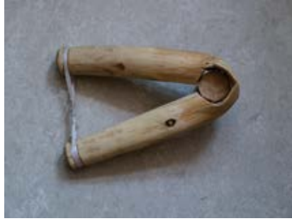
Korzystka (u kosi)

ro n czka albo korzystka ... nie wiem dlaczego akurat tak ... ale ... można powiedzieć ro n czka ... można powiedzieć korzystka ... nie? ... jeżeli ktoś się orientuje to wie o co chodzi ... jak ja pamiętam z małych lat ... to ojciec mój to mówił korzystka na to ... łopaty to raczej tam były z prostym trzonkiem ... bez tej korzystki ... no aczkolwiek już później te mniejsze ... ja jak pamiętam tam ... to były proste ... bo te wie n ksze to majo przeważnie ... miały! ... bo teraz to przeważnie ... o! ... tak jak to ... można powiedzieć ... nowy szpadel ... to już jes i metalowy trzonek ... i ... i ten ... (Czr); korzystka i trzonek; re n kojeś to jes trzonek ... i ... zależy ... bo to różnie mówili ... ja mówię na to korzystka ... tak jak u nas mówili ... korzystka ... a w innych regionach Polski mówili impel ... (Śwd); [szpadel] cze n s żelazna ... korzystka na ro n czce może być ... poprzeczna ... (Gol); 2. 'przy-mocowany z boku kosiska uchwyt umożliwiający koszenie': korzystka to