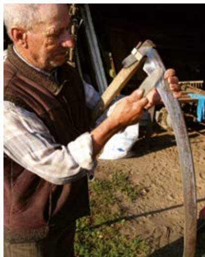
Ostrzyć kosę