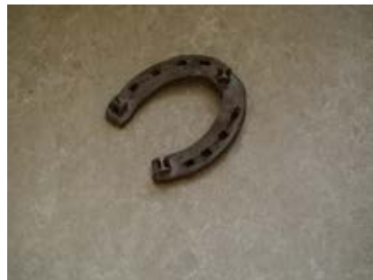
Podkowa zimowa