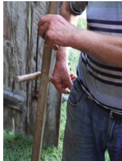
Ro n czka na kosisku