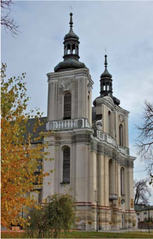
Fot. 13 Wola Gułowska. Kościół Karmelitów Nawiedzenia NMP

cieszaków – na cmentarzu pochowana jest trzecia żona pisarza. Do Adamowa konno Sienkiewicz przyjeżdżał po lekarstwa dla chorej matki, a do dziś istniejący kościół opisał w noweli Jamioł . Okrzeja – tu znajdują się 15-metrowy kopiec Henryka Sienkiewicza oraz kościół, w którym przyszły pisarz otrzymał chrzest. W Woli Gułowskiej w XIX w. ojciec Sienkiewicza wydzierżawił folwark, natomiast w dworku Kraśnickich ostatnie lata życia spędziła jego matka.