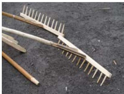
Grabie (fot. Jerzy Sierociuk)

grabie I – ‘drewniane narzędzie rolnicze wykorzystywane zazwyczaj do uprawiania terenu lub podczas sianokosów’: rozrzucały siano ... suszyły ... przewracały grabiami ... i okapiały ... w kupki ... (Osn); rozbija sie pokosy ... przewraca sie ... dawniej re n cznie ... grabiamy ... teraz to już mechanicznie ... kilka razy aż uschnie ... (Bur); podawał te siano widłami do góry ... na wóz ... widły i grabie były tutaj potrzebne ... (WOk); no to grabiami