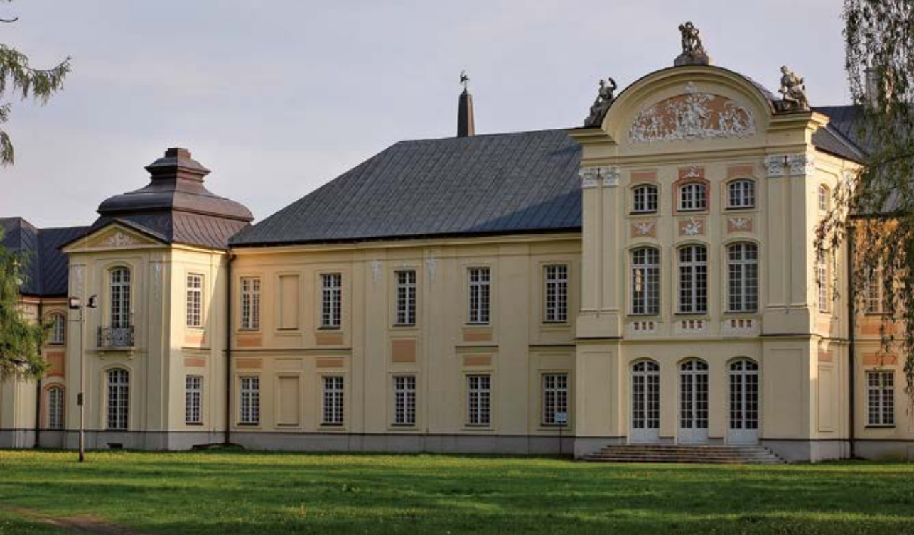
Fot. 11 Radzyń Podlaski. Pałac Potockich

rzeniem w Łukowie Szkoły Handlowej, którą w 1918 r. przekształcono w gimnazjum. W latach 1915–1918 organy samorządowe utworzyły Łukowską Radę Powiatu i Radę Miejską – organy niemające odpowiednika w całym Królestwie Polskim. Powstała wówczas Milicja Obywatelska była jedyną polską milicją na terenie trzech zaborów.