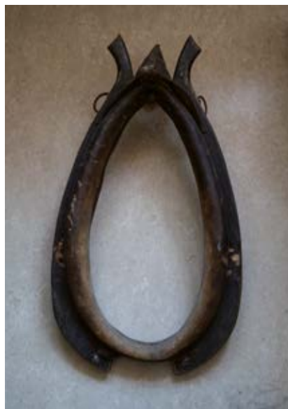
Chomo n t (krakowiak)

mo n t ... (Brm); chomo n ty były przeważ- nie ... chomo n t ... bo byli (!) i tak jak pan mówi pasy ... że tu na piersi miał pasy ... a chomo n ta nie miał ... (Grd); zakładało sie chomo n t na niego ... (WPn); konia sie wprowadzało mie n - dzy hołoble ... przyczepiało sie ... na paski ... te hołoble z jedny strony na pasek ... z drugi strony na pasek ... a z tyłu przy zadzie ... był orczyk ... i musiały być łańcuszki od chomo n tu ... przyczepione do tego orczyka ... i do- piero można było konia ... koń musiał mieć lejce ... i można było już wtedy konia prowadzić ... przy wozie ... (Grz); wprowadzało sie konia mie n - dzy ołoble ... ołoble sie podnosiło ... przyczypiało (!) sie do chomo n ta za po- moco pasków ... i do orcza za pomoco pasów albo łańcuszków ... (WDm); chomo n t jes ... kantar jes ... i wkłada sie mie n dzy górno a dolno szcze n ke takie metalowe ... to kielzno tak zwane ... u nas sie z dwóch metalowych takich pre n tów poło n czonych ze sobo ... i na