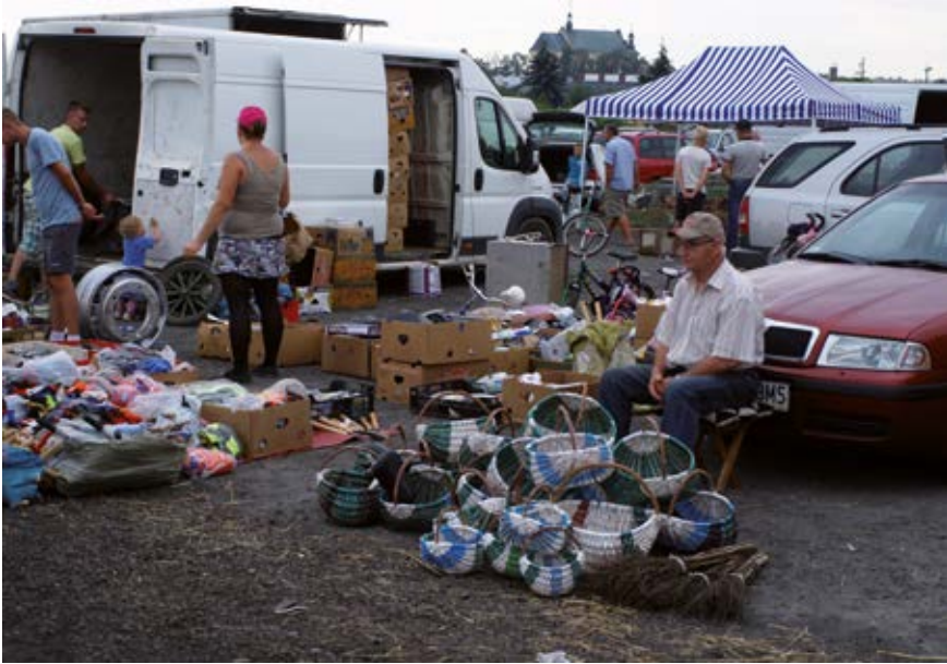
Rynek (w Łukowie)

młotkiem po samym ostrzu ... albo trochę był ... nie bardzo widzo o cy ... albo re n ka mu sie trze o sła ... to uderzył dalej ... i wtedy metal sie ... tutaj sie wydłużał ... i ni miał sie dzie podziac ... rybił kose ... (Njm); zob. porybić kose, poszczerbić, poże o dlyć, wyrybić kose, wytrybić kose.