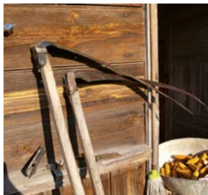
Odsadnia (kosa)

odsadnia – ‘o kosie osadzonej pod zbyt dużym kątem względem kosiska’: odsadnia za bardzo odsadzona ... od kosiska odsadzona jes ... (Bur); sie kose klepało do trawy to trza było wyklepać jo równo ... i bez pałó n ka ... bardziej przysadnia ... do zboża bardziej odsadnia i z pałó n kem ... (Bur); jeżeli kosa jest ... tu dostane ... i do czuba dostaje ... to jest kosa dobrze obsadzona ... jeżeli kosa jest wyge n ta w drugó (!) strone ... to jest odsad- nia ... jeżeli czubek ... jest ścio n gnie n ta w te strone ... to jest przesadnia ... jak jo zegne ... to ona sie robi przy- sadna (!) ... (Dąb, SKb); [odsadnia?] to znaczy że był czub odsunie n ty od kosiska i od kosiarza ... (Osn); mierzyło sie ry n kami tak ... kładło sie na szyi ... do ro n czki ... do kosy sie patrzyło ... z jedny strony od czuba ... i od tyłu ... przesadnia to jest złożóna wie n cy do człowieka ... a odsadnia to odłożóna ... (Brz); to je kosa przesadnia ... a to odsadnia ... (Czr); to odczuł kośnik w czasie koszenia ... albo przysadnia ... albo odsadnia ... przysadnia to szła