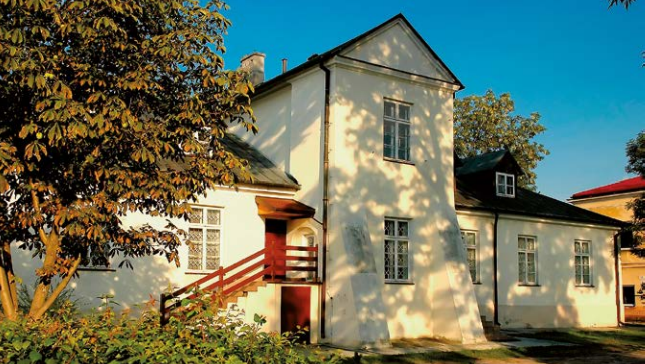
Fot. 8 Łuków. Dawny konwikt Szaniawskich, obecnie Muzeum Regionalne (fot. Waldemar Mularczyk)

W okresie piastowskim ziemia ta była słabo zaludniona przede wszystkim ze względu na trudne warunki naturalne – puszcze, mokradła, bagniska otaczające wielkim kołem Łuków.