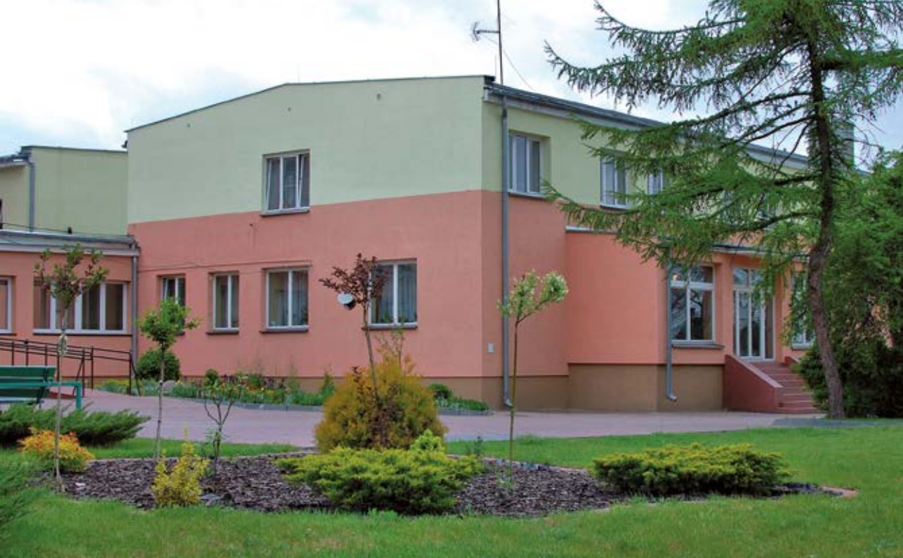
Fot. 6 Internat szkolny