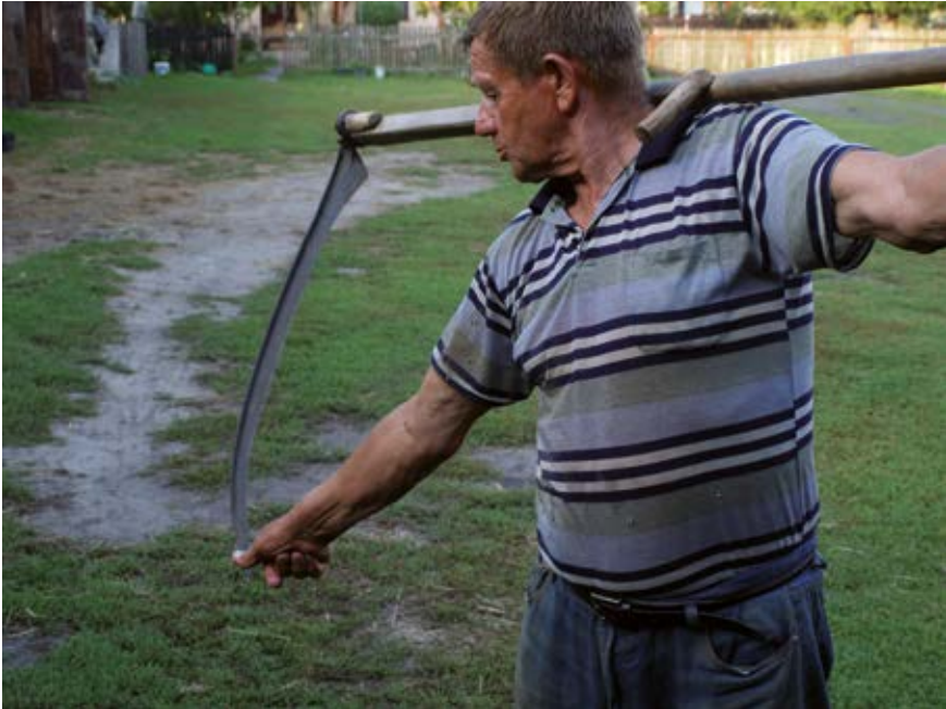
Kośnik sprawdza osadzenie kosi

wszyte w połowie tego karbło n ka (!) ... i narzucane to zboże ... jak zrzynał kośnik ... to nakładał na rosno n ce zboże ... tyn pokos ... to sie nazywało pokos ... (Grz); zob. kosiarz .