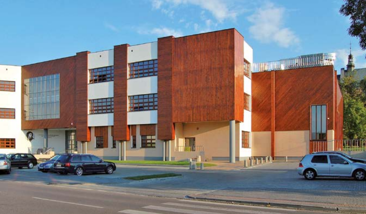
Fot. 3 I Liceum Ogólnokształcące im. T. Kościuszki w Łukowie

obecnie we współpracy z chórem i orkiestrą szkolną Hiberniaschule w Herne (Niemcy), przygotowuje koncerty muzyczne adresowane do lokalnych społeczności. W każdym projekcie udział bierze ok. 200 uczniów. W 70. rocznicę zakończenia II wojny światowej do współpracy zaproszona została też młodzież z Izraela. Do tej pory odbyły się takie koncerty muzyki poważnej nie tylko w Łukowie, ale także w Bonn, Essen, Gelsenkirchen, Wuppertalu, Berlinie, Lublinie, Warszawie. W repertuarze chóru znalazły się m.in. takie utwory, jak: Stworzenie świata Josepha Haydna, Carmina Burana Carla Orffa, Niemieckie requiem Johannes Brahmsa, Msza koronacyjna C-dur i Requiem d-moll Wolfganga Amadeusza Mozarta, Alleluja z oratorium Mesjasz Georga Friedricha Händla, Verleih uns Frieden Felixa Mendelssohna-Bartholdy'ego, Fuga Jana Sebastiana Bacha, The Armed Man Karla Jenkinsa oraz polskie pieśni patriotyczne i religijne.