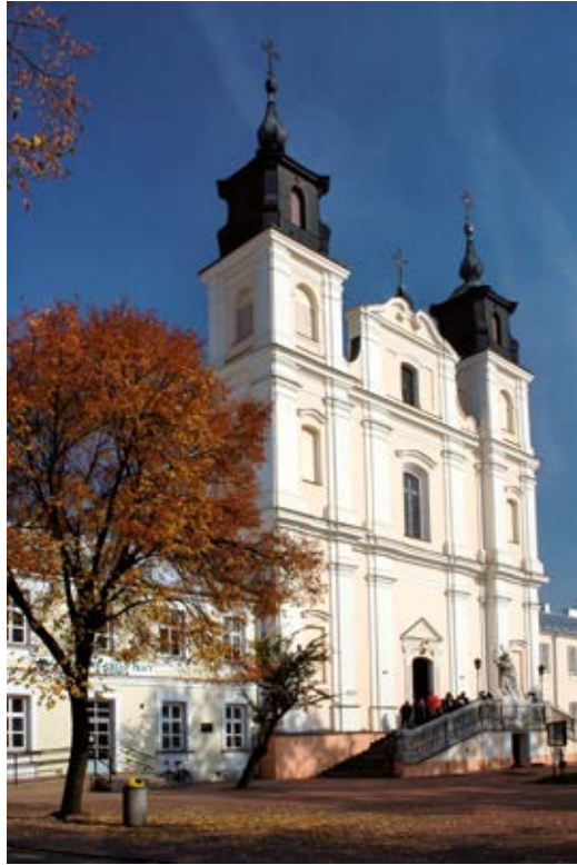
Fot. 7 Łuków. Kościół pw. Przemienienia Pańskiego

trzy powiaty: lubelski, urzędowski oraz ziemię łukowską, która zajmowała obszar 1800 km 2 . Południową granicę wyznaczała rzeka Tyśmienica. Na północy ziemia ta wciniała się szerokim klinem między Mazowsze i Podlasie, obejmując południowe tereny obecnego powiatu siedleckiego. Na wschodzie graniczyła z dwoma województwami: brzesko-litewskim od południa oraz podlaskim (na odcinku drohiczyńsko-mielnickim) od północy. Granica między ziemią stężycką a łukowską przebiegała z południa na północ, od Wieprza w okolicach Kocka do granicy z Mazowszem w rejonie wsi Płozy, czyli Szyszki, przecinając kilka pogranicznych parafii (Kock, Wojcieszków, Wilczyńska). Był to teren pograniczny na styku Podlasia, Lubelszczyzny i Mazowsza. Na przestrzeni dziejów zmieniała się przynależność do poszczególnych województw (lub ich odpowiedników).