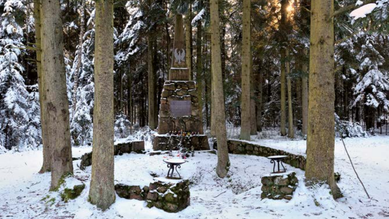
Fot. 9 Pomnik ks. gen. Stanisława Brzóska w rezerwacie Jata

zasiedlenia obejmowały ok. 275 osad 10 . Tempo osadnictwa zaczęło słabnąć w końcu XVI w., a w XVII i XVIII stuleciu praktycznie zostało zahamowane. Do końca I Rzeczypospolitej utrzymało się w ziemi łukowskiej 5 miast (Łuków, Kock, Radzyń, Siedlce, Serokomla) 11 .