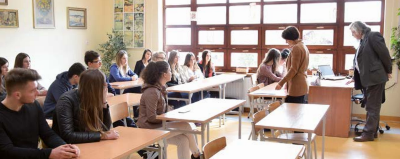
Fot. 2 Warsztaty dialektologiczne dla zainteresowanych

skich; dodatkowo zaś na wysokości łukowskiej tego obszaru przebiega granica gwar ukraińskich i białoruskich (co też daje się tu zauważyć). Dla dialektologa jest to zatem obszar niezmiernie interesujący.