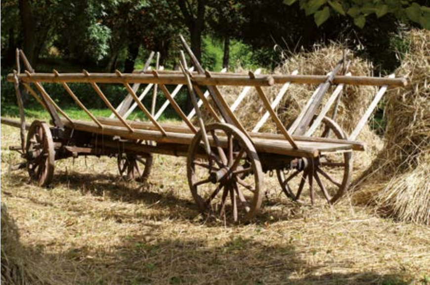
Drabiniasty wóz

dorzo o dzić – ‘dodać przypraw celem poprawy smaku’: dorzo o dza sie do smaku ... (Bur); zob. doprawić .