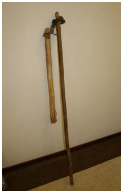
Cepy (fot. Jerzy Sierociuk)

cepy – tylko lm. ‘dawne narzędzie do mlócenia; składały się z bijaka i dzierzaka, łączyła je go n zewka : mlóciły cepamy ... (Brz, Bur, Fik, SKb, WKs); no i cepami sie mlóciło ... a jakie konkretne? ... oj tam! ... jak było wie n cy chłopów to ich dwóch (!) stawało ... wiesz ... i mlócili (!) ... tak lup lup ... tup lup ... to tak mlócili (!) na jednej stronie ... bo to sie rozpościerało ... to zboże ... snopyk rozwio n zywało ... rozpościerało ... wymłóciły (!) na jednej stronie ... przekre n cały (!) na druge stronie ... wymłóciły (!) ... i później sie przetrzo n chało ... wio n zało pe n czki ... słome ... a zboże znouż sie do wiania zgarniało ... (Śwk); kiedyś to